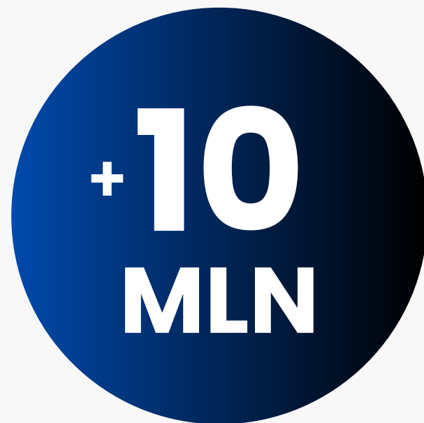
Utenti unici mensili